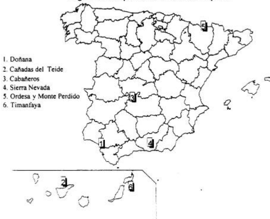
Algunos Parques Nacionales de España